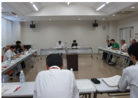
案件を審議する策定委員さん