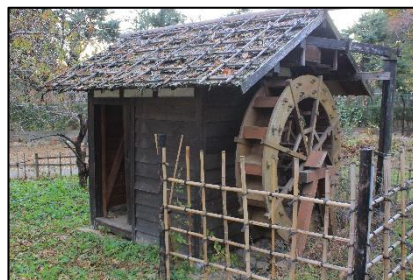
緑の王国内(ふかや村)