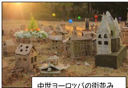
中世ヨーロッパの街並み