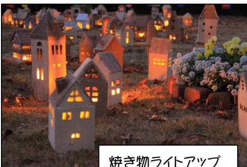
焼き物ライトアップ

真っ赤に染まった紅葉を堪能し、日が落ちるとライトアップした紅葉や、市内小学生手作りの行燈、 あんどん 緑の王国ボランティアが製作した中世ヨーロッパの街並みをイメージした焼き物のあかり、竹細工のあかりたちが温かく輝いていました。NPO法人 地域環境緑創造交流協会(うるおいのまち)による軽食販売では、カレーパンやかぼちゃのスープ、温かい飲み物もあり、心も体も温まる交流会でした。