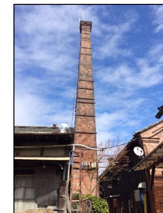
古き良き インスタ映えスポット