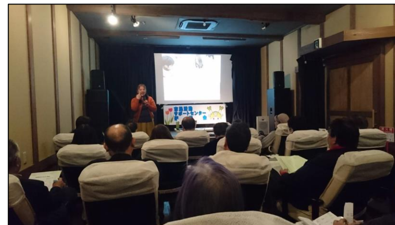
【右】 SNS セミナー時の様子