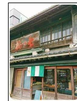
会場となった、 旧七ツ梅酒蔵跡

パソコンやスマホが苦手でもできる、安心安全な SNS 集客術、効果的な活用方法をメールなどでも配信。オンライン受講も開催中。